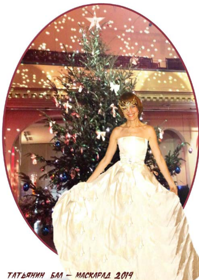
ТАТЬЯНИН БАЛ – МАСКАРАД 2014